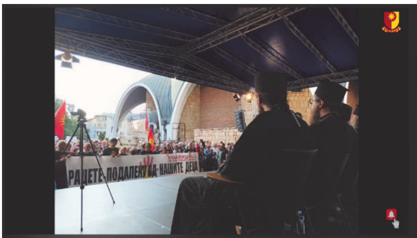
Скриншот од емисијата каде што е прикажан транспарентот на „Родина Македонија“ во прв ред од протестот на МПЦ

Во емисијата, лидерот на „Родина Македонија“ и главната анти-родова активистка се фалат и со транспарентот во прв ред на „Коалиција за заштита на децата“ – прикажувајќи го како партиски транспарент.