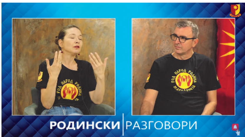
Скриншот од емисијата „Родински разговори“ од 30.06.2023